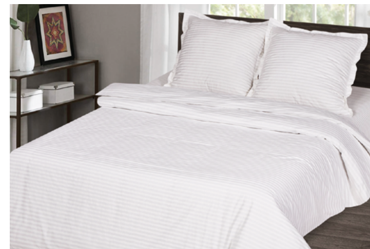
Отель 1 x 1 (белый)