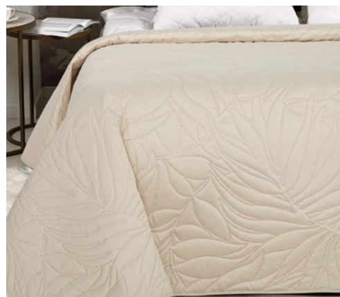
Ваниль (с кантом)