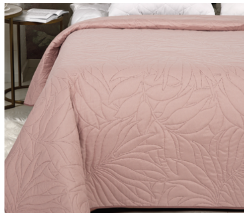
Пыльная роза (с кантом)